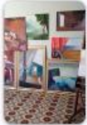
Centro de Atenção Psicossocial CAPS II