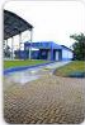
Centro de Atenção Psicossoci al Infanto juvenil CAPS I