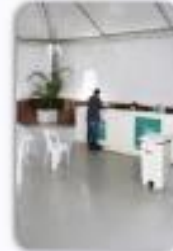
Hospital de Campanha