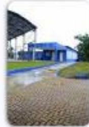
Centro de Convivência CECO