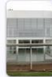
Centro de Atenção à Saúde da Mulher