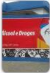
Centro de Atenção Psicossocial Álcool e Drogas CAPS -A.D.