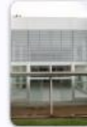
Centro de Especialidades Médicas